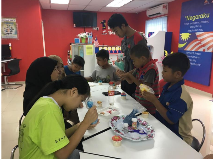
Peserta sedang menghias kek cawan