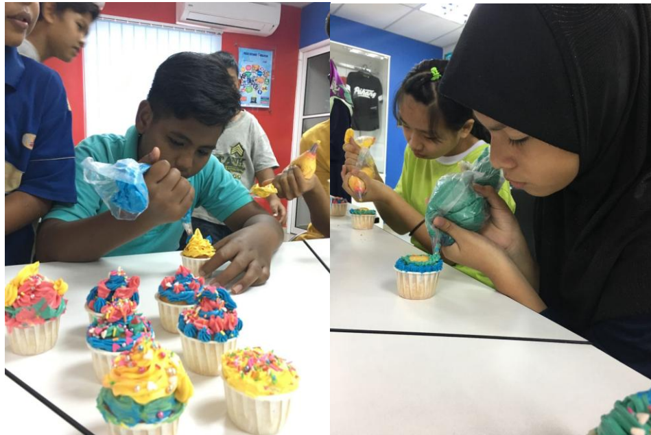
Peserta sedang menghias kek cawan