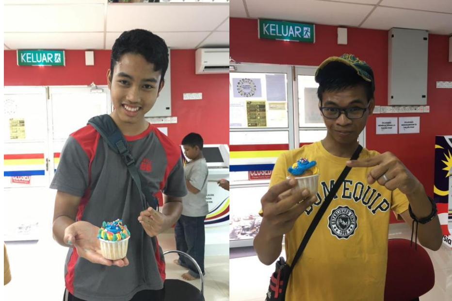
Antara hasil dekorasi kek cawan