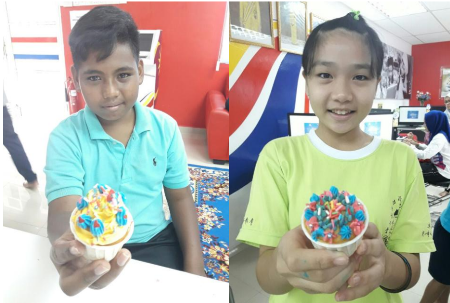
Antara hasil dekorasi kek cawan