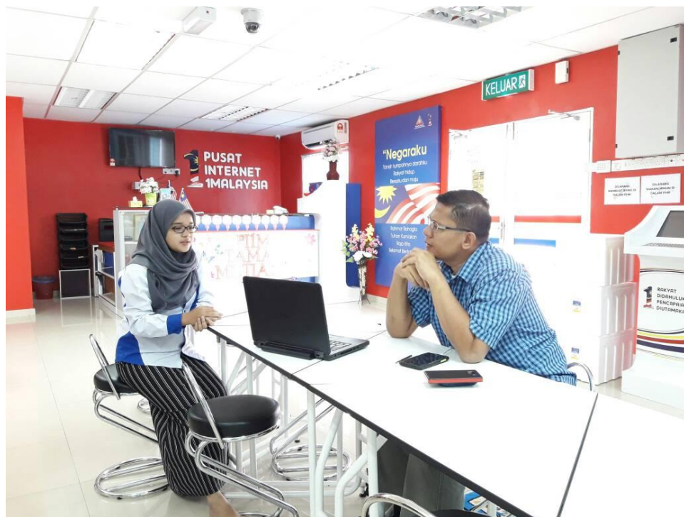
Sesi menimba ilmu