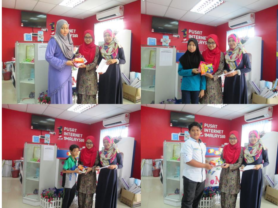
Pemenang pertandingan menaip dan puzzle kdb kanak-kanak