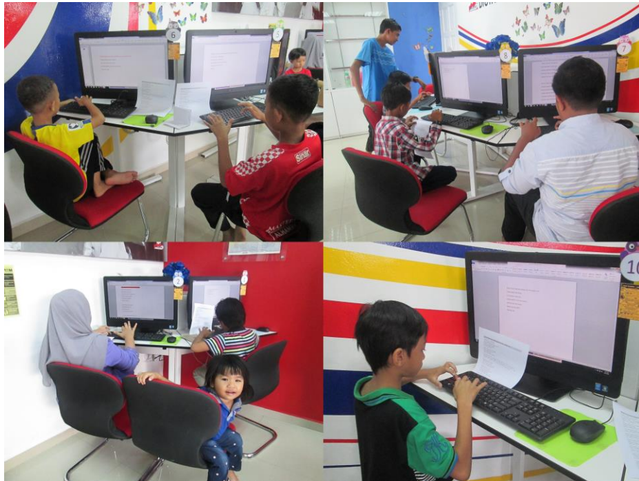
Pertandingan menaip (kanak-kanak) sempena hari raya anjuran PIIM