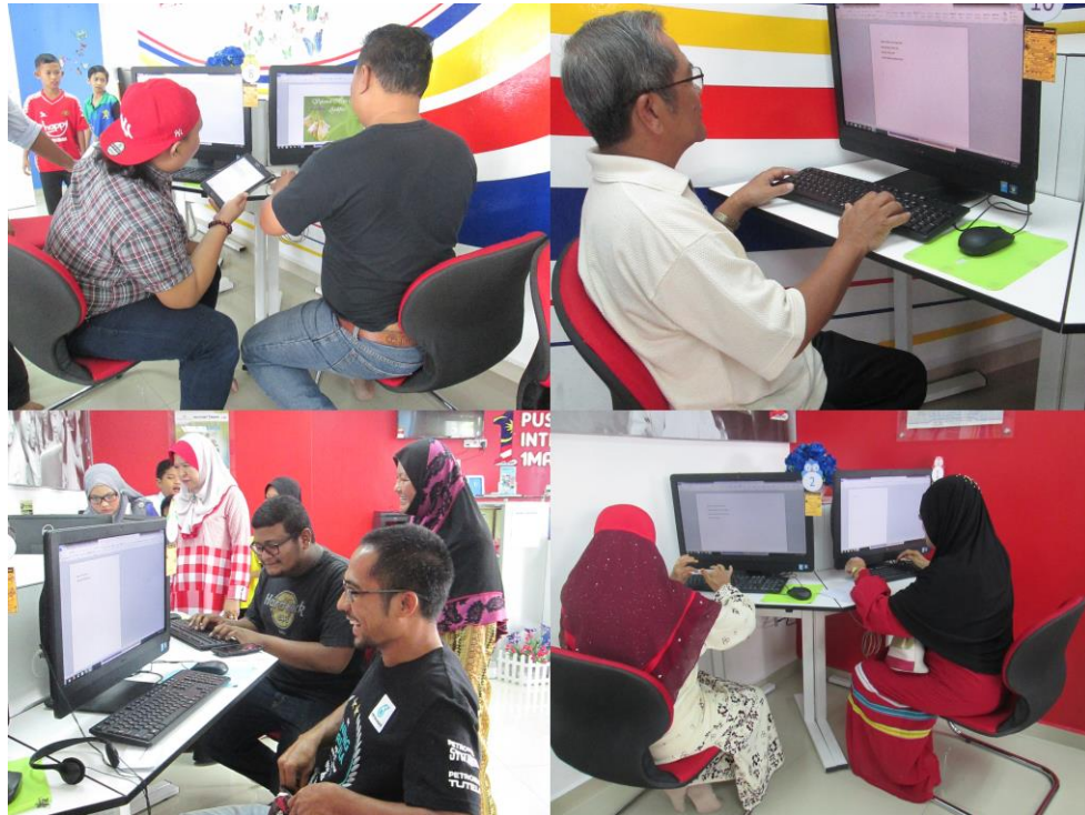
Pertandingan menaip pantun (dewasa) sempena hari raya anjuran PIIM