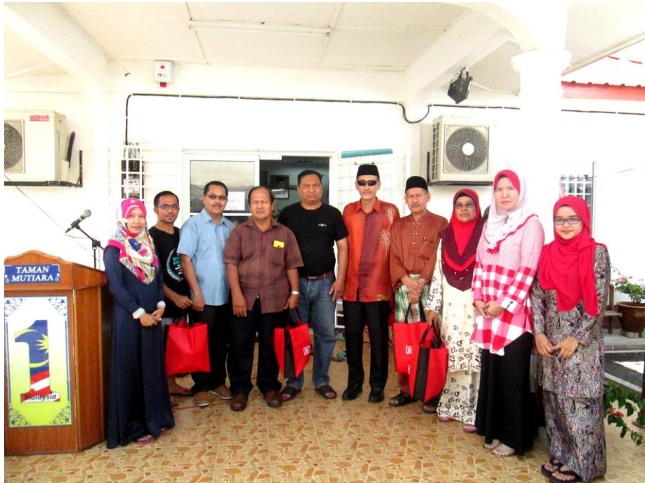
Pemenang pertandingan menaip dewasa