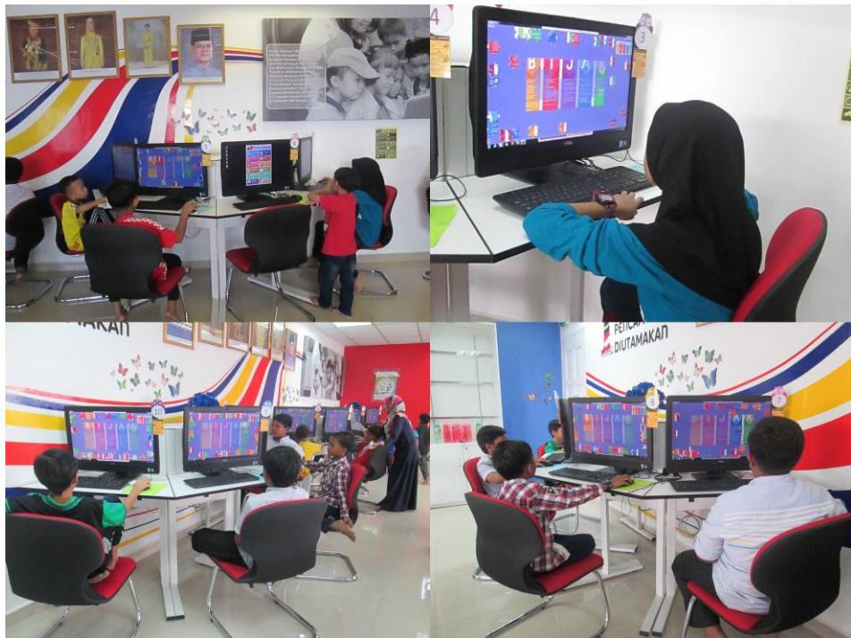
Pertandingan puzzle KDB (kanak-kanak) anjuran PIIM